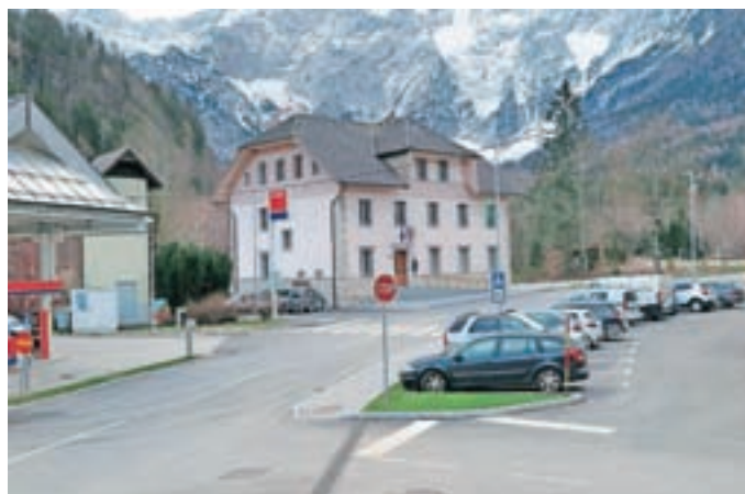
Središče Jezerskega je v celoti urejeno

"Dejstvo je, da je z obveznim financiranjem dejavnosti in s projekti, ki še potekajo, proračun že precej izčrpan in za nove projekte ne bo ostalo kaj dosti denarja. Sem se pa odločil, da vsa sredstva, ki gredo za društvene programe, vrnemo na izhodišče izpred štirih let, saj želim podpreti društveno življenje v kar največji meri. Sredstva za društva so bila v preteklosti okleščena zaradi projekta urejanja središča vasi. Dolgoročno je za našo skupnost pomemben projekt toplovoda oz daljinskega ogrevanja. Tu bo največji izziv najti zainteresirane, ki bodo v projektu prepoznali priložnost in izziv. Naložba je ekonomsko upravičena, če bodo na voljo dodatna sredstva iz državnih razpisov in bo zagotovljeno zadostno število odjemnikov toplotne energije. Sistem bo upravljala razvojna za-